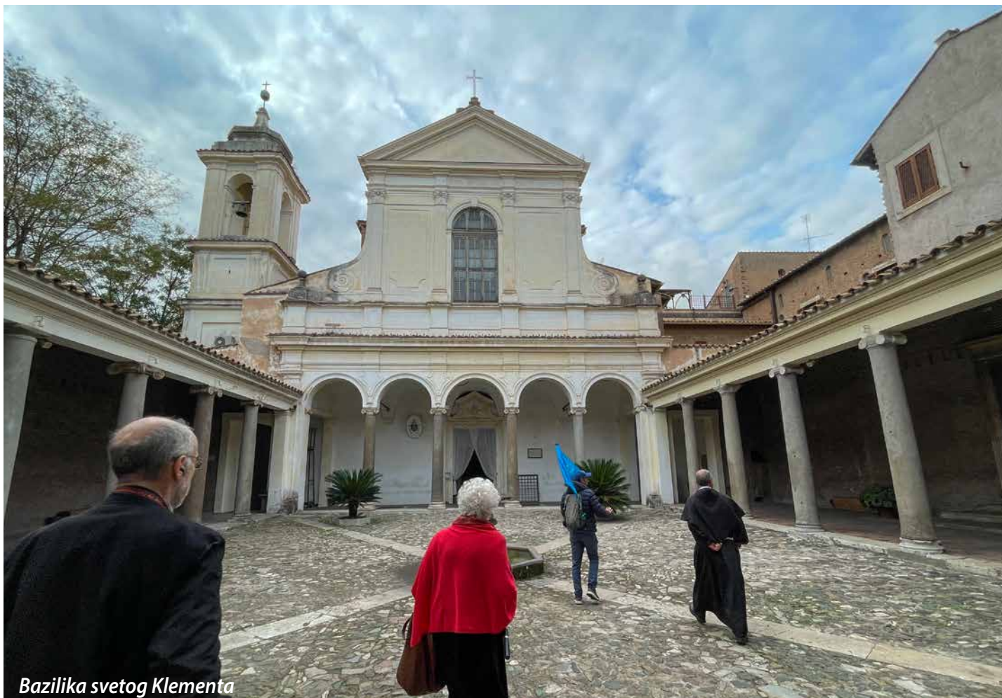
Bazilika svetog Klementa