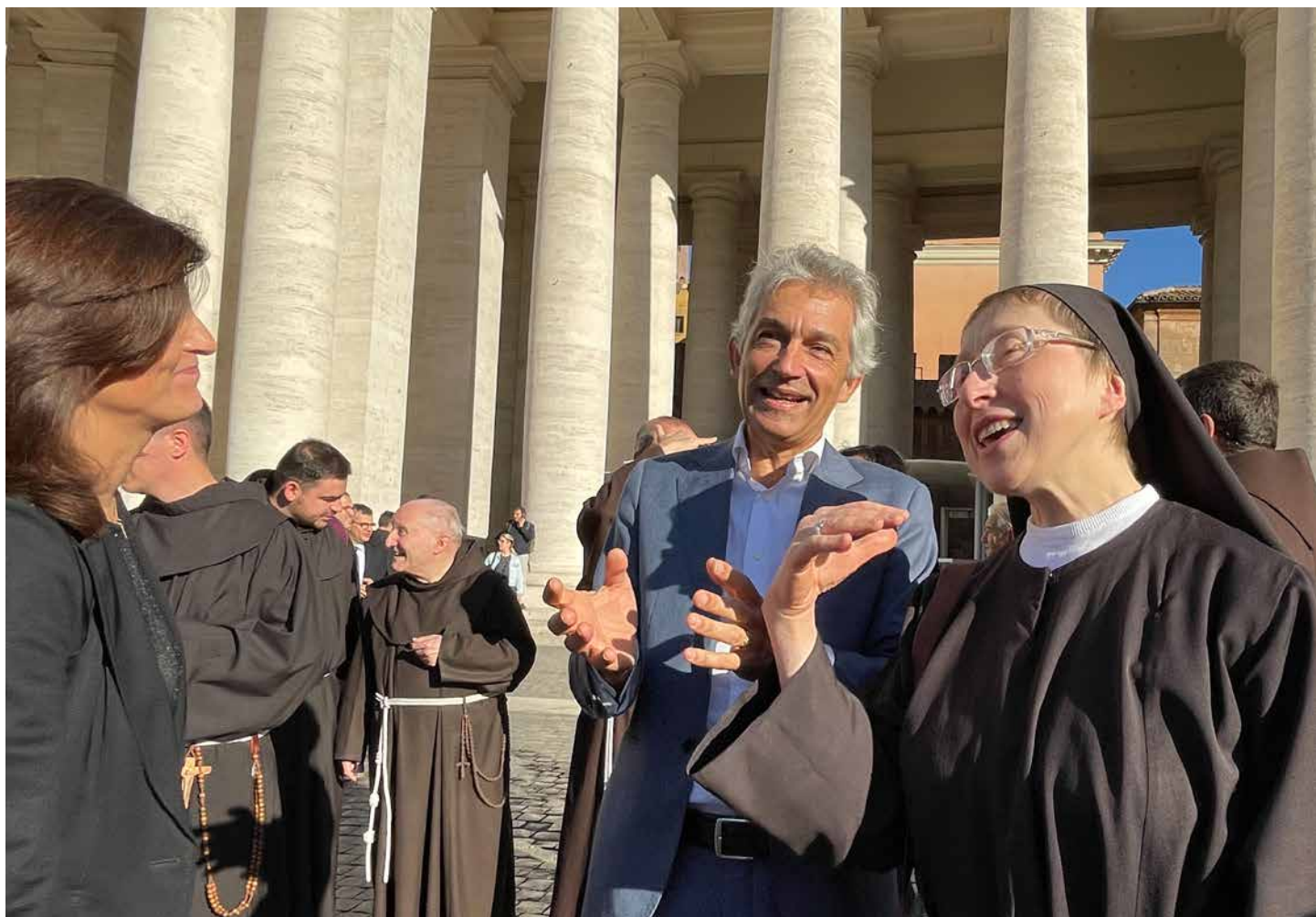
Braća franjevci, svjetovnjaci i klarise okupljeni na Trgu sv. Petra, izražavaju radost pripadnosti istoj obitelji.