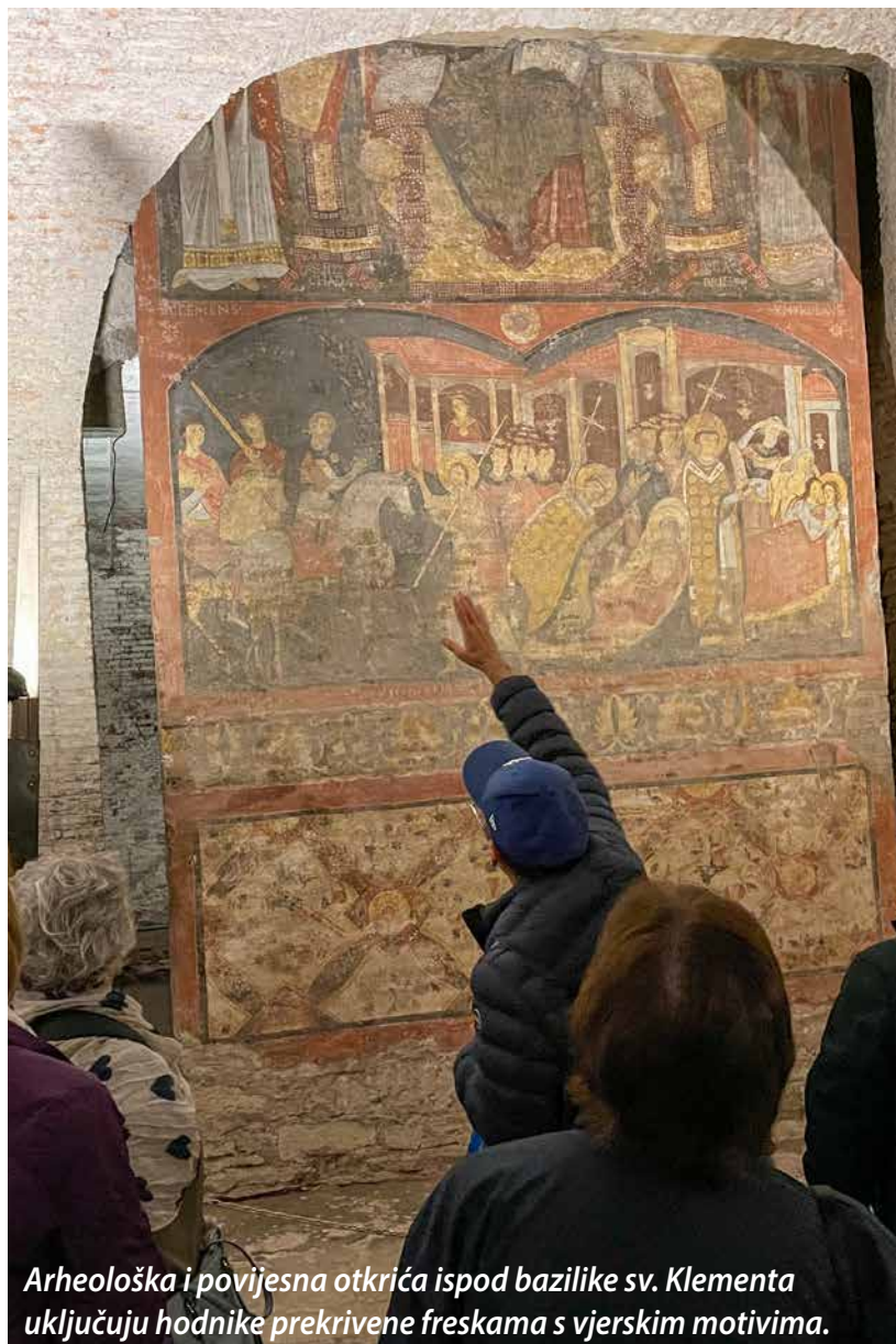
Arheološka i povijesna otkrića ispod bazilike sv. Klementa uključuju hodnike prekrivene freskama s vjerskim motivima.