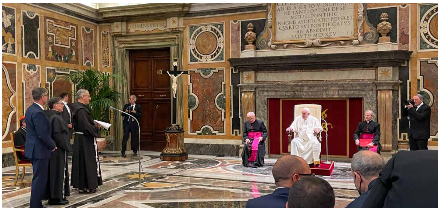
Generalni ministar OFS-a Tibor Kauser i generalni ministar OFMConv fra Carlos Alberto Trovarelli pridružili su se generalnom ministru OFM-a Massimu Fusarelliju u obraćanju papi Franji u kojem je pojasnio kako franjevci žele javno obilježiti obljetnice.